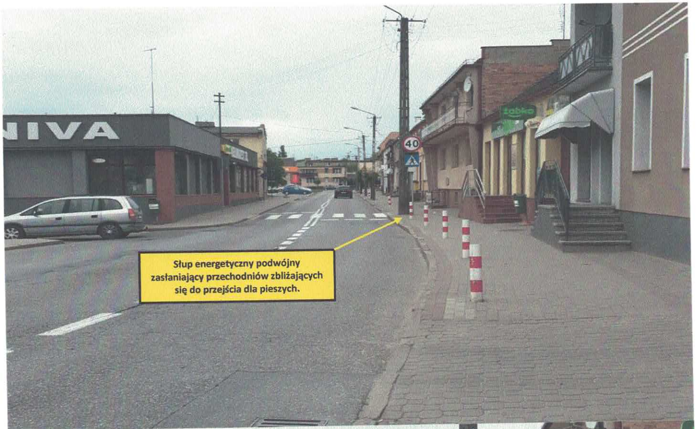
Słup energetyczny podwójny zasłaniający przechodniów zbliżających się do przejścia dla pieszych.