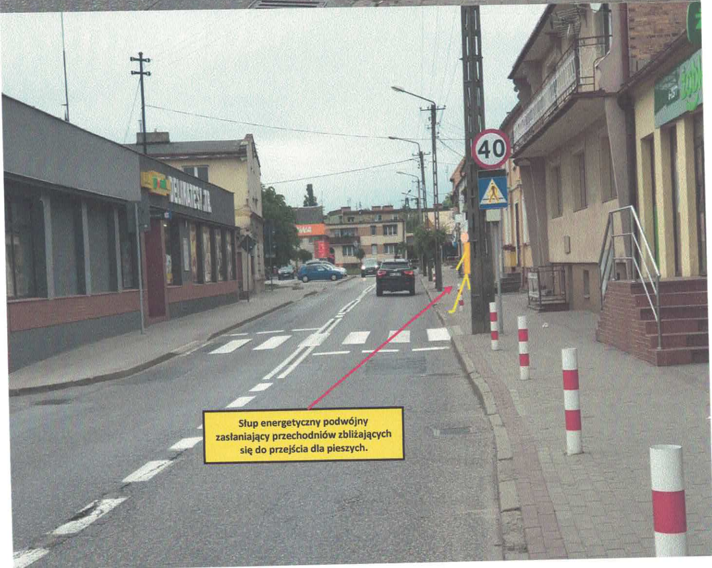
Słup energetyczny podwójny zasłaniający przechodniów zbliżających się do przejścia dla pieszych.