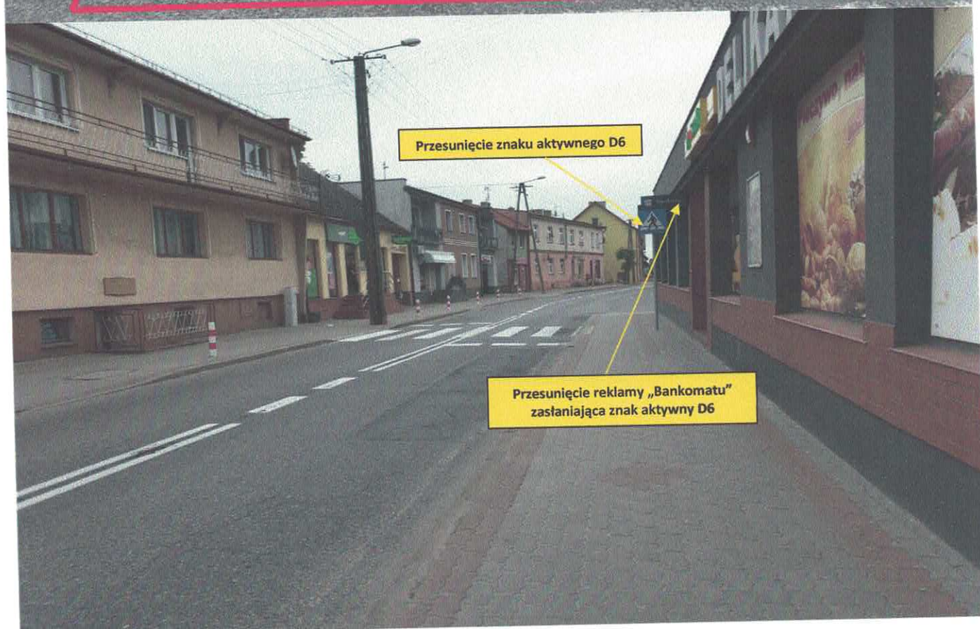
Zdjęcia (Nr 1 – Nr 4) przejścia dla pieszych ul. Pocztowa w Wysokiej w ciągu drogi wojewódzkiej DW nr 190.