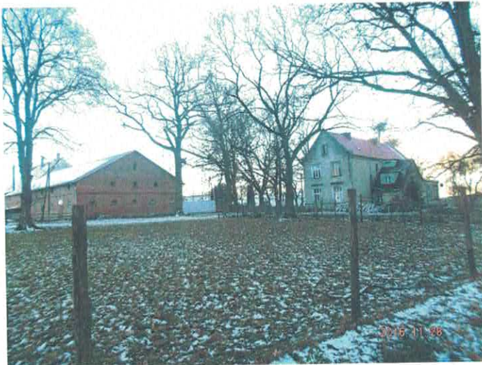
Fragment zespołu dworsko – folwarcznego