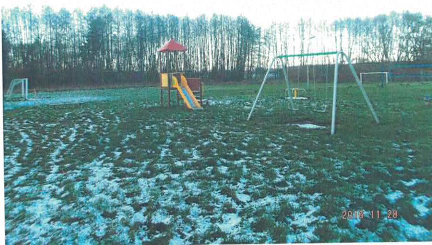
Plac zabaw i boisko

Infrastruktura społeczna to świetlica wiejska usytuowana w zabytkowym parku, plac zabaw wraz z boiskiem sportowym i wiatą wypoczynkowo-rekreacyjną – usytuowane w pobliżu świetlicy. Wszystkie te obiekty wymagają doposażenia w urządzenia lub w sprzęt (m.in. siłownię zewnętrzną, sprzęt gospodarstwa domowego, sportowo – rekreacyjnego itd.). Zaś plac zabaw, wiatę i boisko dodatkowo w sieć elektryczną.