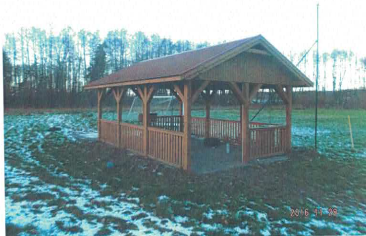
Wiatę wypoczynkowo – rekreacyjną