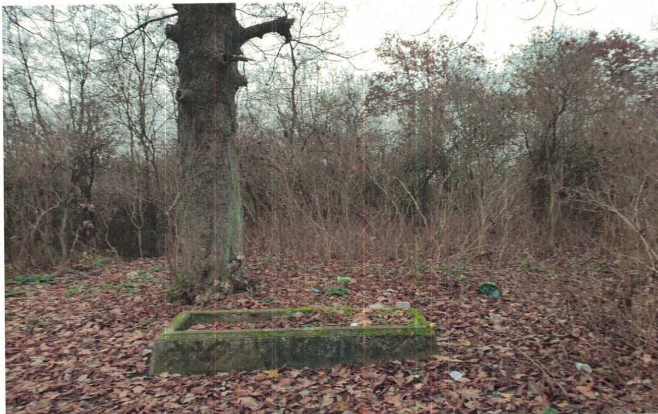
Zdjęcie od nr 5 do nr 7 z 2021 roku – Widok zanieczyszczenia w otoczeniu pozostałych „resztek grobów” w dalszej części terenu cmentarza „poniemieckiego”.