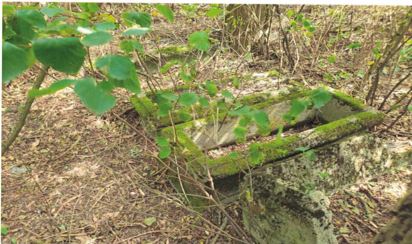
Zdjęcie od nr 8 do nr 9 z 2021 r. – Widok betonowych „obramowań” resztek grobów na terenie cmentarza.