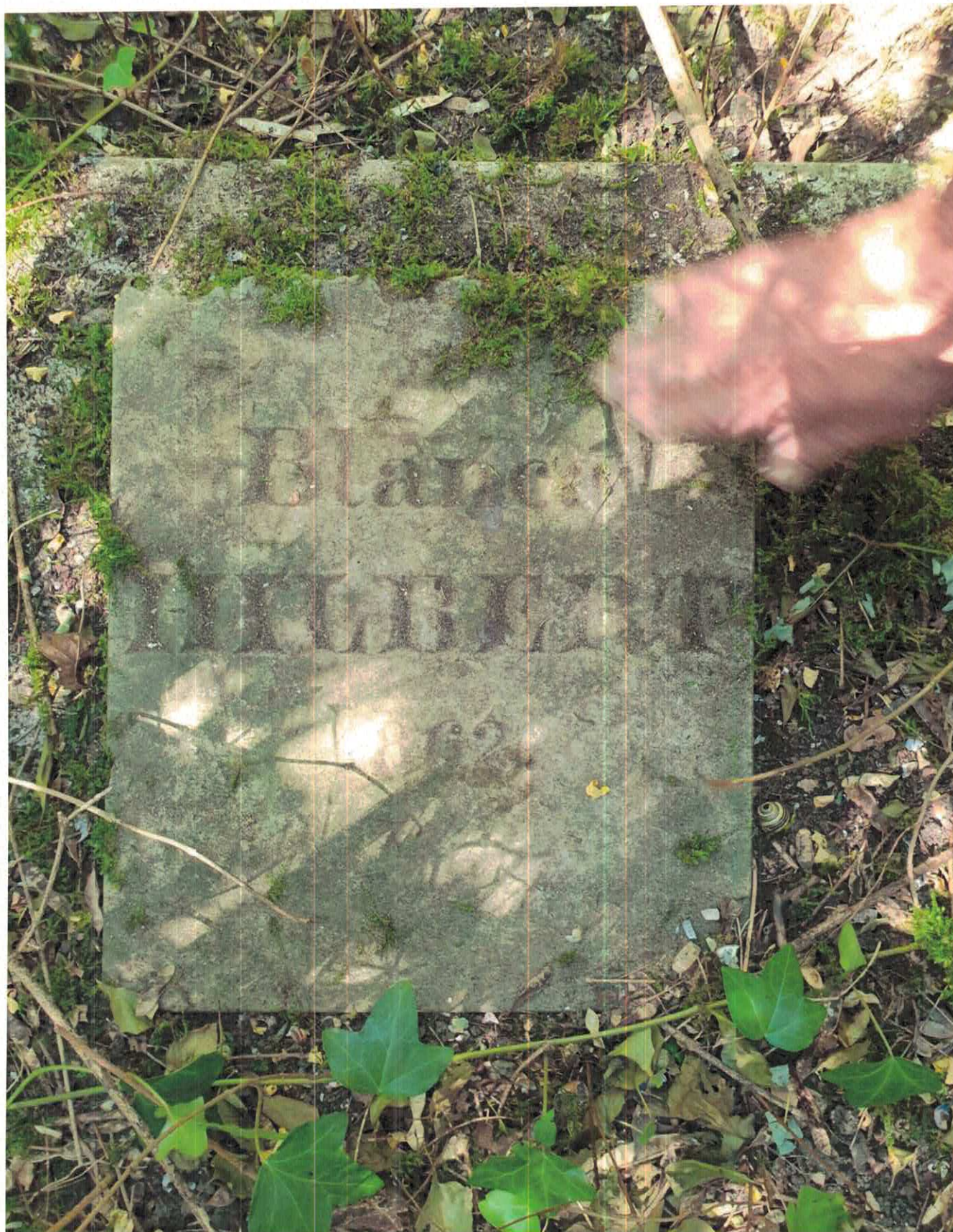
Zdjęcie nr 10 z 2021 r. – Widok pozostałej betonowej płyty nagrobka z widocznym napisem B.H. z 1862r. która „przetrwała” raczej z powodu, iż nie była z granitu czy marmuru, które były rozkradane w latach 70 / 80 z ww. cmentarza.

Opracował: Henryk Stańczyk, dnia 16.03.2022r.