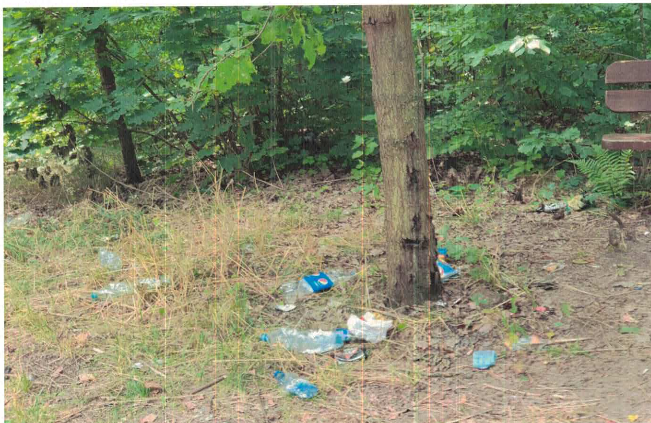
Zdjęcie od nr 1 do nr 3 z 2021 roku – Widok zaśmieconego terenu cmentarza „poniemieckiego” w otoczeniu przeniesionej „gminnej ławki” z ulicy Ogrodowej.