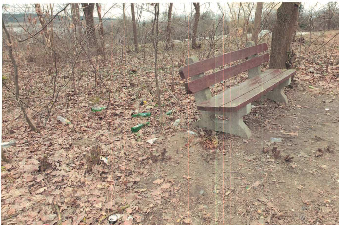
Zdjęcie nr 4 z 2022 roku – Widok zaśmieconego terenu cmentarza „poniemieckiego” w otoczeniu przeniesionej „gminnej ławki” z ulicy Ogrodowej.