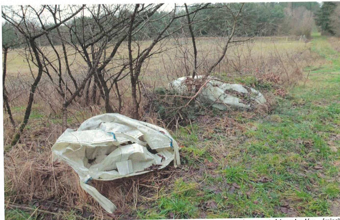
Zdjęcia od nr 1 i do nr 5 - Widok z dnia 03.11.2021r. pozostawionych worków jutowych z zawartością „odpadów – śmieci” na „poboczu” gminnej drogi gruntowej (dz. nr 783 obręb geodezyjny m. Wysoka) zlokalizowanej w „Górach Wysockich”.