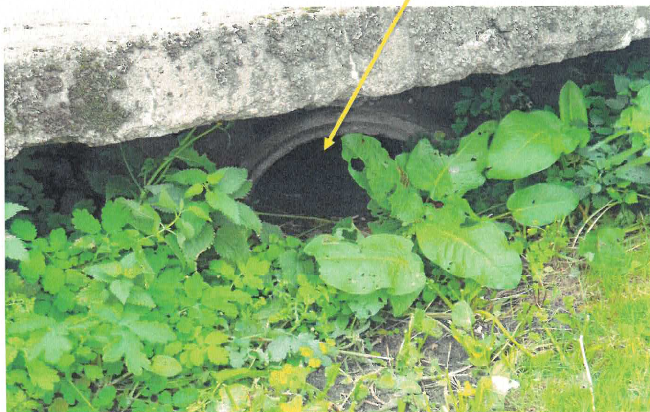
Zdjęcie nr 1 i nr 2 - Widok „niedroźnego” przepustu pod drogą Rudna – Mościska (za zakrętem – wyjazd z m. Rudna.)