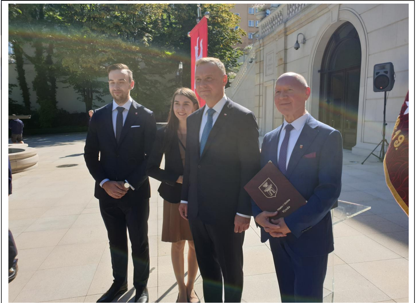
Zdjęcie nr 2 i nr 3 – Wspólne zdjęcie z Prezydentem Rzeczypospolitej Polski Panem A. Dudą.