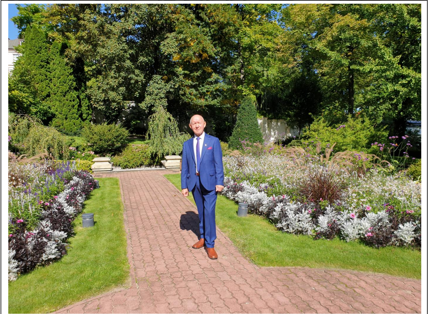
Zdjęcie (zbiór własny) nr 4 i nr 5 - Widok „Ogrody Zewnętrzne” na terenie Pałacu Prezydenta RP.