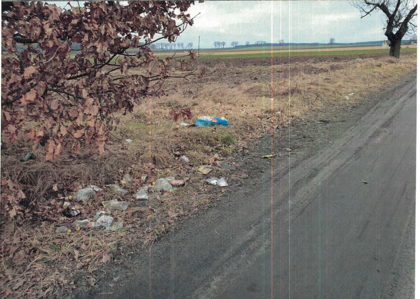
Zdjęcie nr 3 i nr 4 - Widok „wyrzuconych śmieci - odpadów” na poboczu drogi Wysoka – Gmurowo (dz. nr 9 obręb miasto Wysoka).