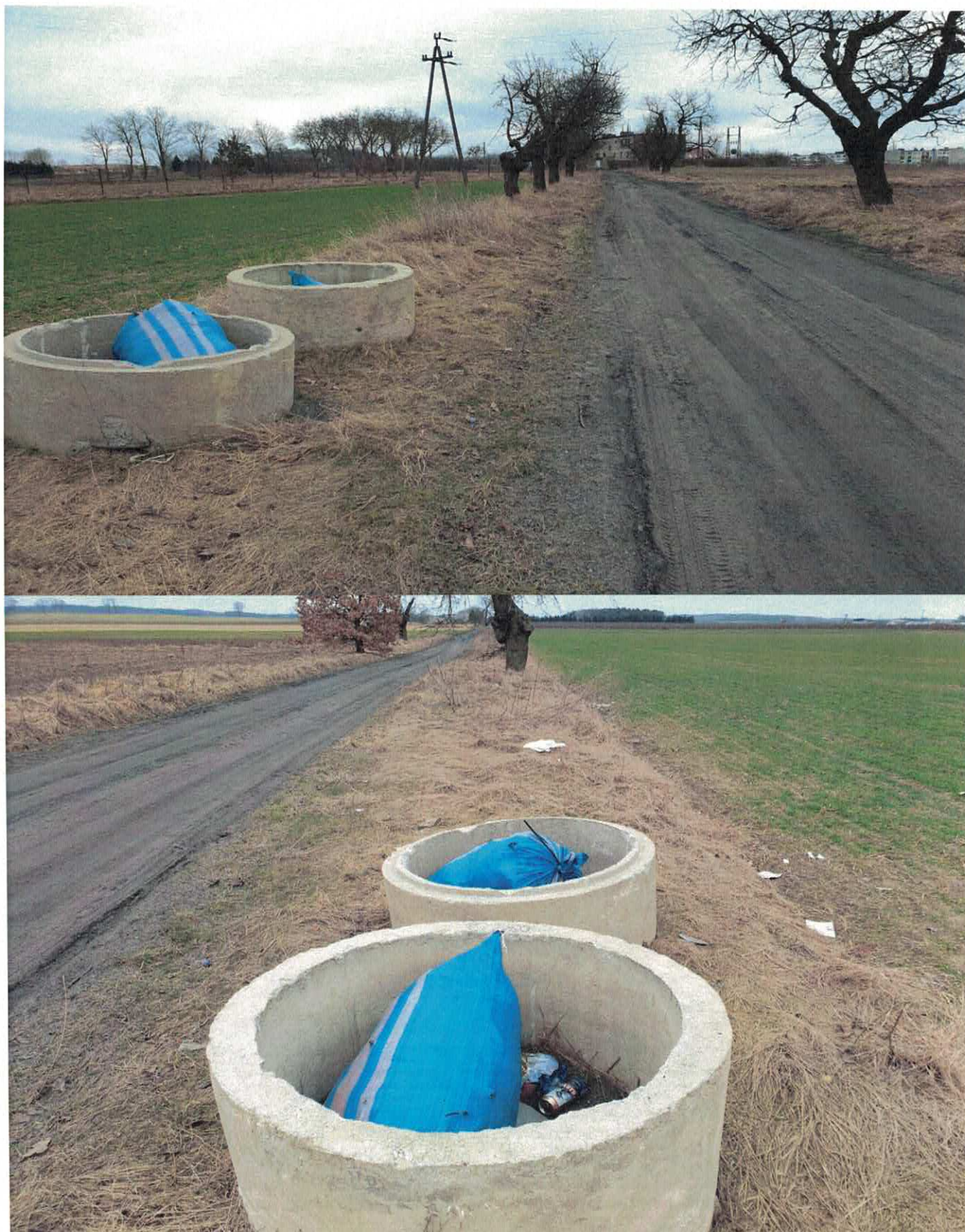
Zdjęcie nr 1 i nr 2 - Widok pozostawionych kregów betonowych na poboczu drogi Wysoka – Gmurowo (dz. nr 9 obręb miasto Wysoka) z pozostałością składowanych „śmieci – odpadów”.