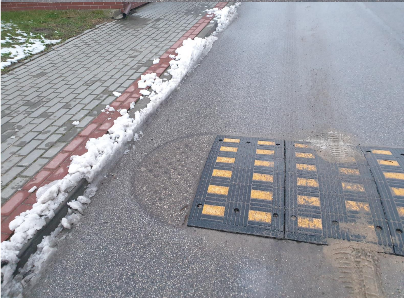
Zdjęcia od nr 1 nr i nr 2 - Widok brakującego elementu progu zwalniającego na ulicy Słonecznej w Wysokiej.