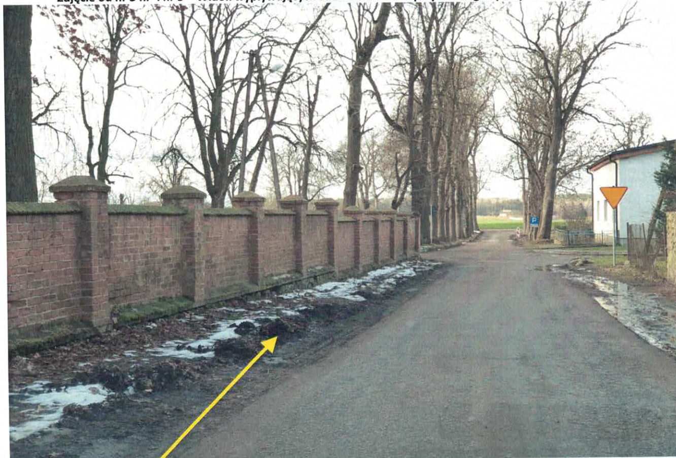
Zdjęcie nr 6 - Widok zalegającego błota przydrożnego przy murze parafialno – kościelnym w Bądeczu.

Opracował: Henryk Stańczyk, dnia 25.01.2021r.