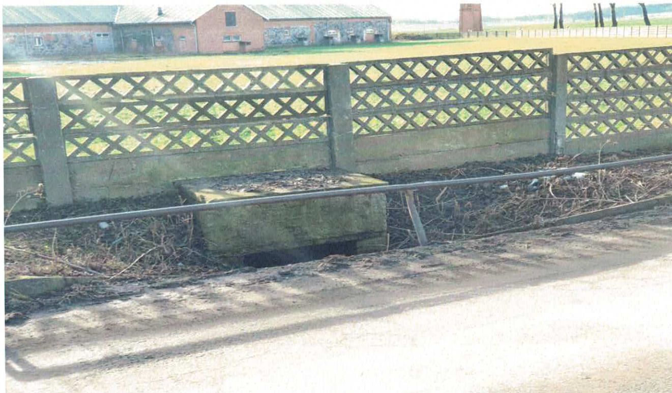
Zdjęcie od nr 3 nr i nr 5 - Widok wypływających ścieków do rowu przydrożnego i przepustu drogowego.