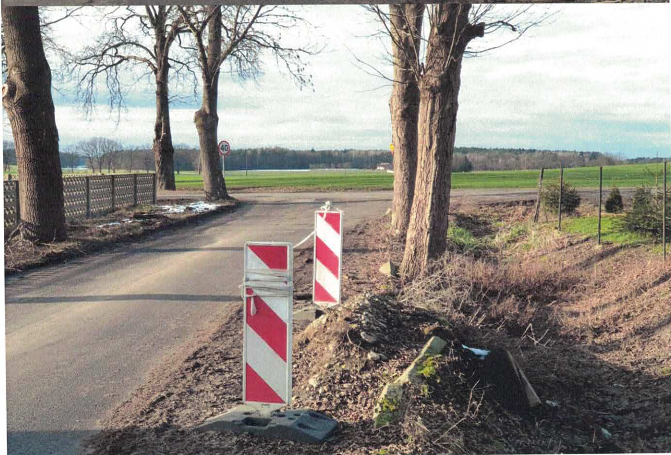
Zdjęcie od nr 1 nr i nr 2 - Widok pozostałości pnia z wyróconego drzewa w 2019 roku na drodze (dz. nr 128) w Badeczu,